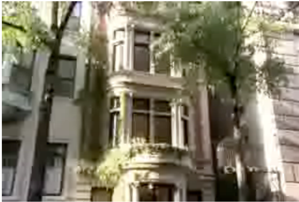
Gossip Girl : la vie de Marie-Antoinette aujourd'hui?

Une icône de la mode, première people et fashion victim?