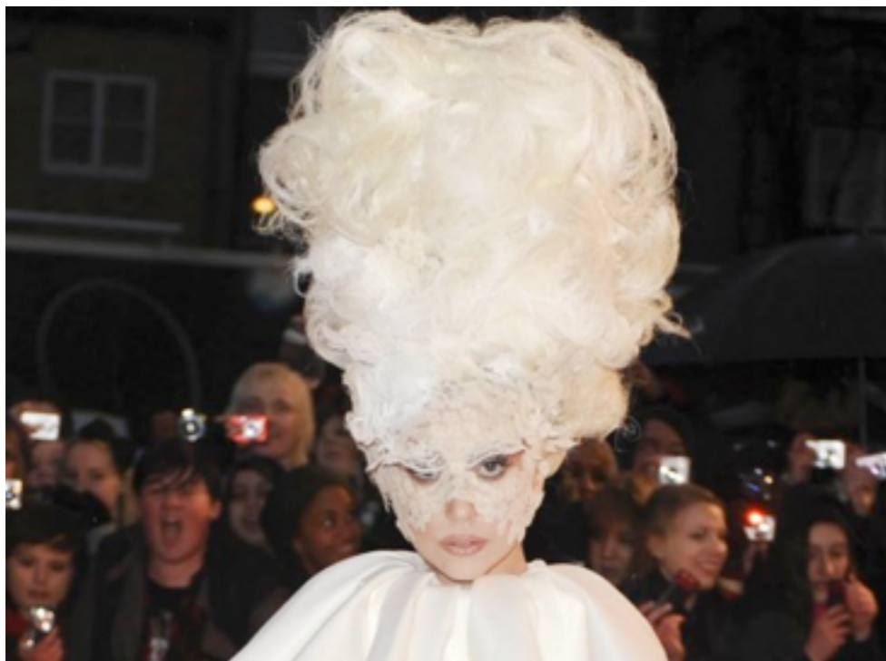
Lady Gaga transformée en Marie-Antoinette lors des Britt Awards 2010

Il s'agit de travailler le film pour faire de l'histoire, objet de consommation dans l'espace public, un objet à interroger, éclairer et débattre en classe avec nos élèves pour en prendre la juste mesure.